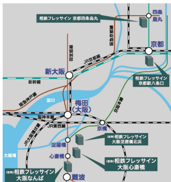
相鉄フレッサイн 関西圏店舗